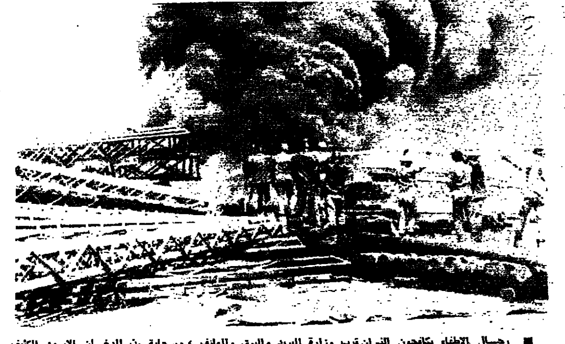
رجال الاطباء يتاجرون التران قرب وزارة البريد والبرق والهاتف، وسحابة بين النخيل الاسود الكفيف ترشق فوق الخطة